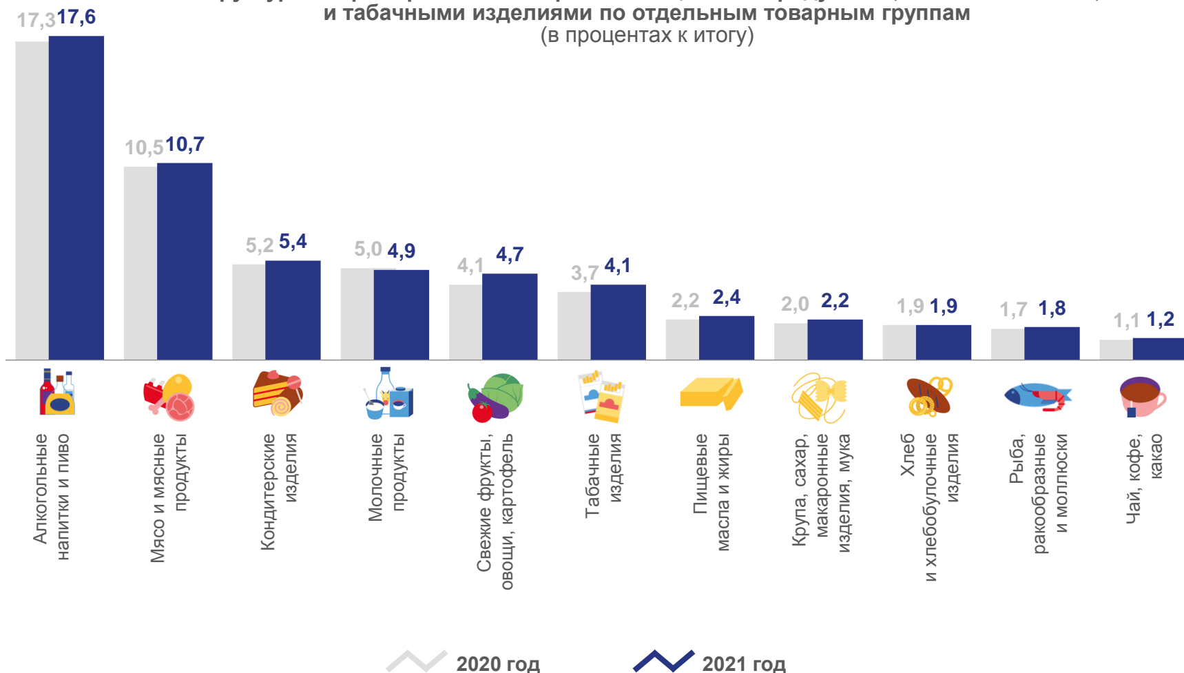
Структура оборота розничной торговли пищевыми продуктами, включая напитки, и табачными изделиями по отдельным товарным группам (в процентах к итогу)